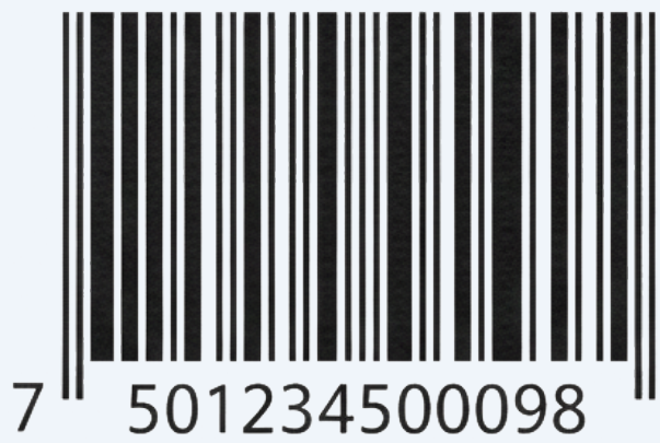
Código de Barras (1D)