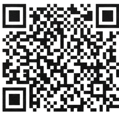
Código QR (2D)